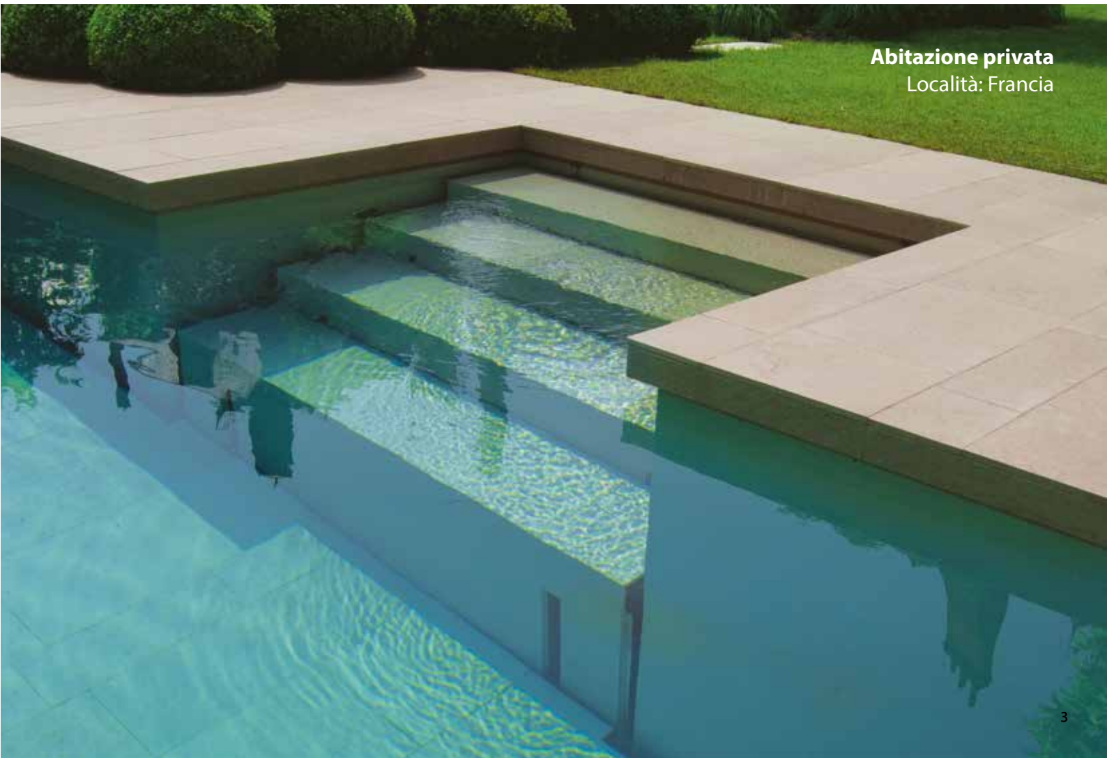
Abitazione privata Località: Francia