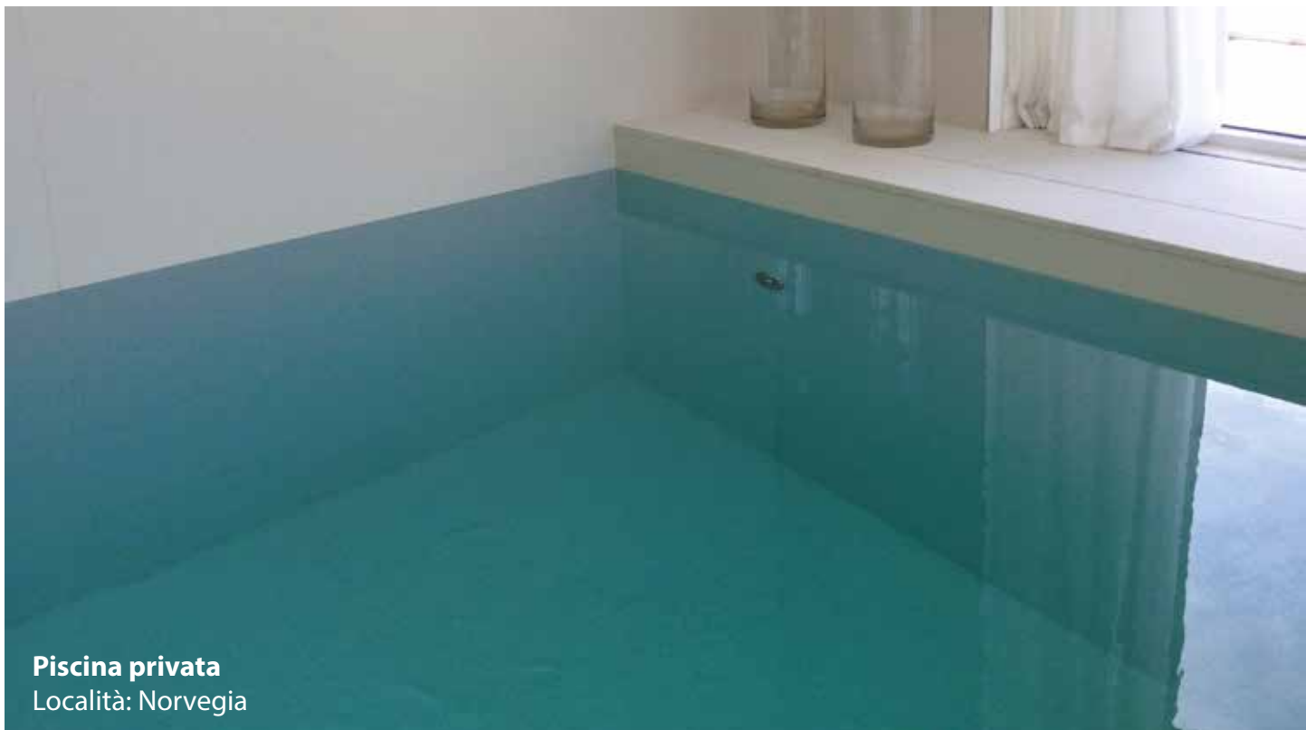
Piscina privata Località: Norvegia