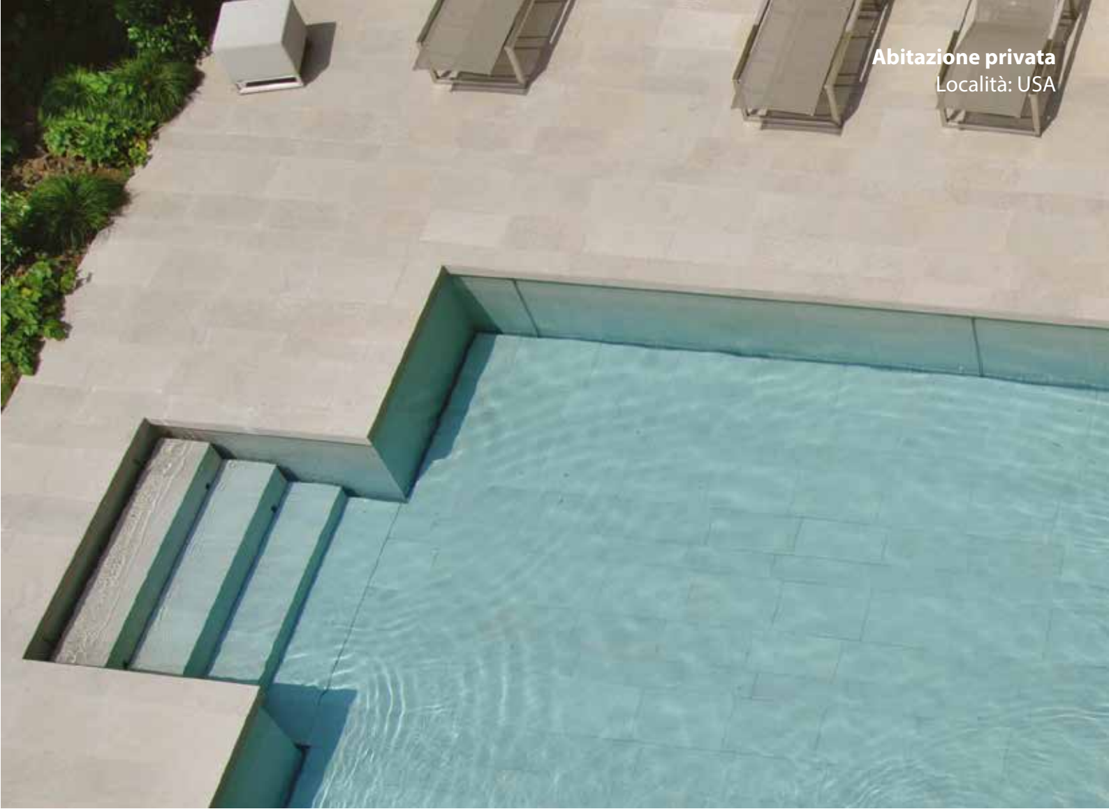
Abitazione privata Località: USA