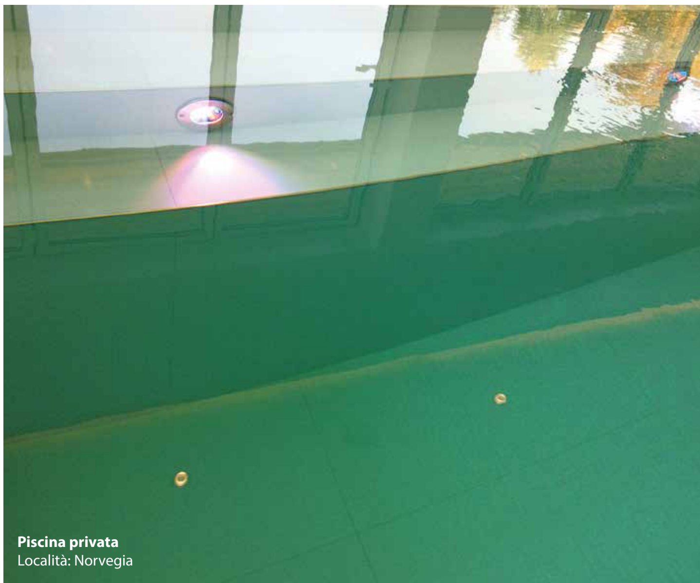
Piscina privata Località: Norvegia

Le indicazioni riguardo ai prodotti proposti e alle modalità di loro uso sono state fornite direttamente dai produttori. Per maggiori indicazioni è possibile contattare direttamente i referenti tecnici delle case produttrici ai riferimenti riportati negli indirizzi utili.