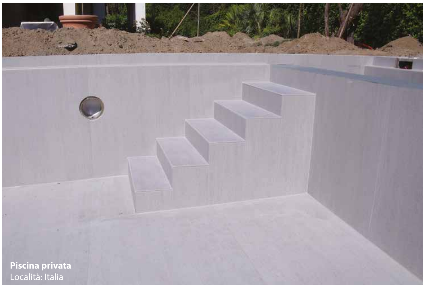
Piscina privata Località: Italia