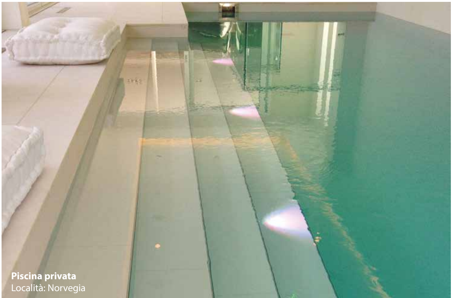
Piscina privata Località: Norvegia

Nelle piscine d'acqua salata o termale si devono utilizzare materiali di presa e di stuccatura speciali.